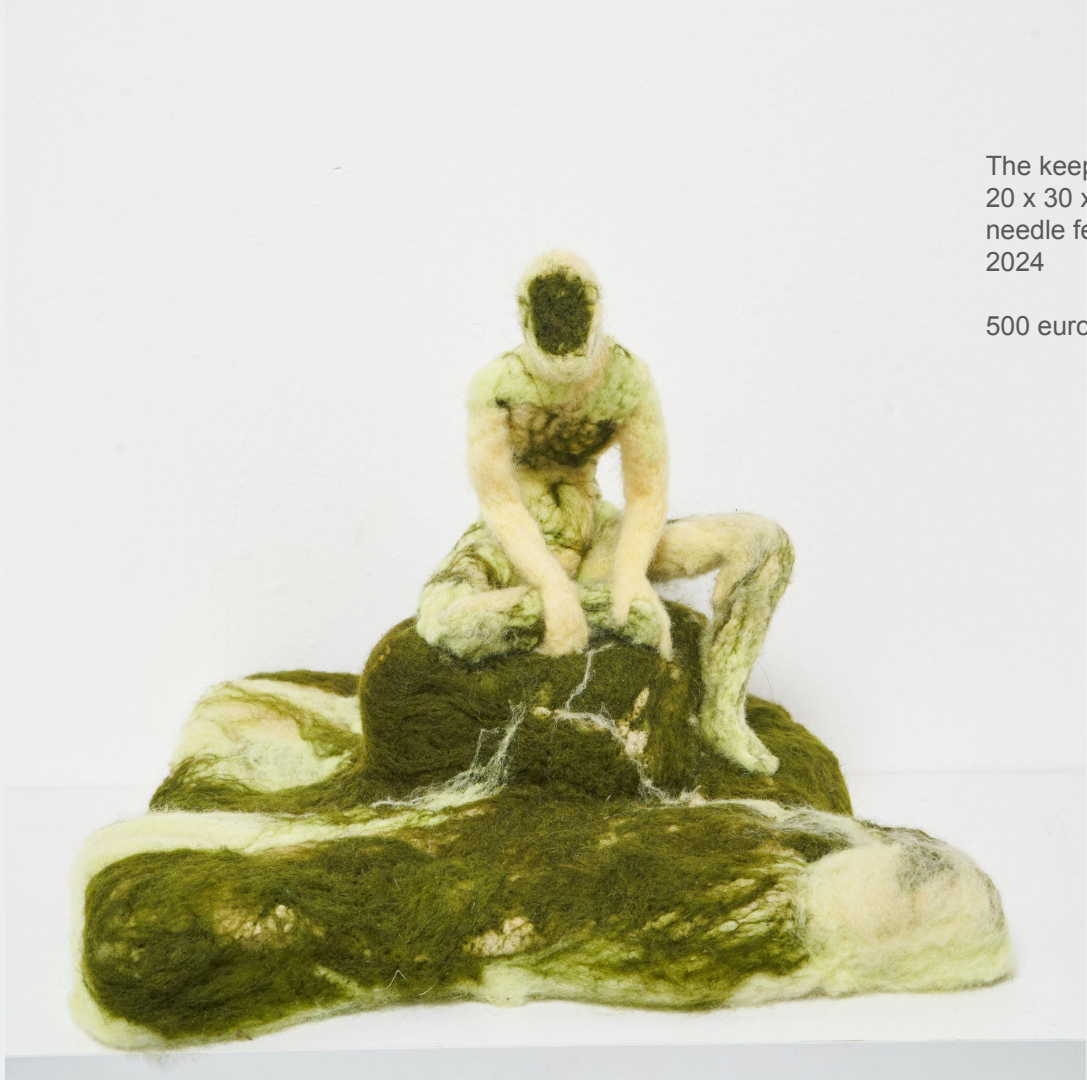
The keeper 20 x 30 x 30 cm needle felt 2024