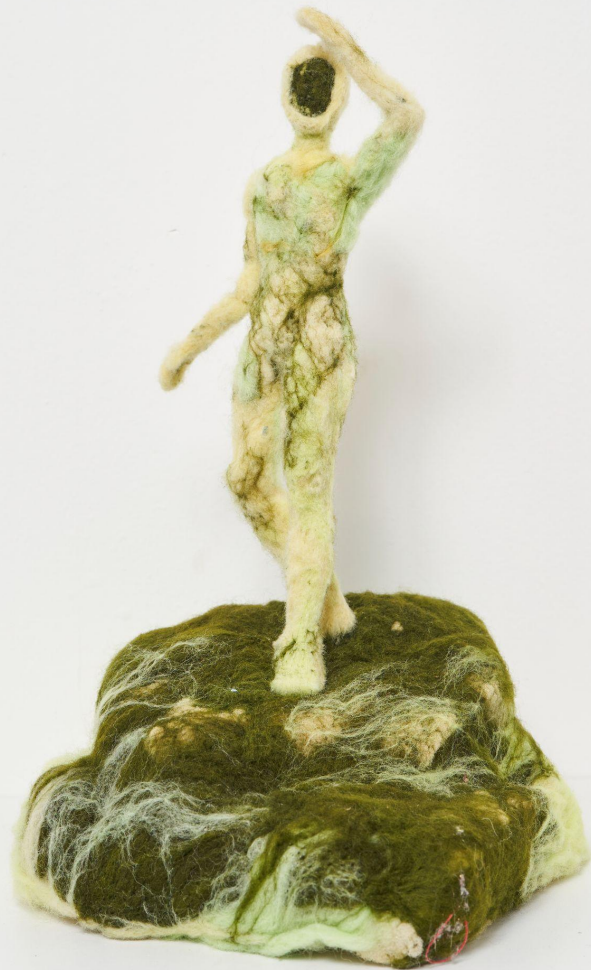
The lookout 35 x 20 x 20 cm needle felt 2024