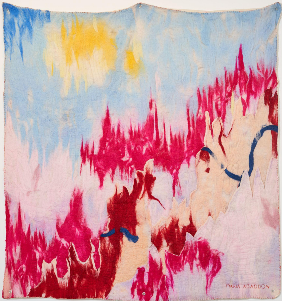
Landscape of destruction 150 x 150 cm wet felt and needle felt 2024