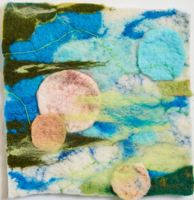
moons and moss landscape 20 x 20 cm wet felt and needle felt 2024